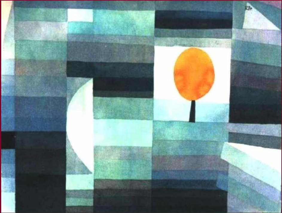
AZ ŐSZ HÍRNÖKE (1922)