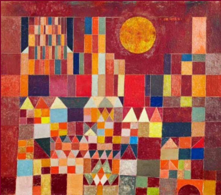
VÁR ÉS NAP (1929)

Autizmus? Mégis mi az? Betegség vagy állapot? Kérdezd meg az autistát, hogy megkapd a válaszod. Ki autista, nem beteg, csak másképpen működik. Te sem gondolsz ugyanarra, amin a másik tűnődik. Sportol, tanul, érdeklődik, megismeri a világot, eközben meg megőrül, ha meglátja a MÁV-ot. Csúfolják, mert más, vagy azért, mert hasonló, azt viszont nem sejtik, hogy a szavak ereje romboló. De még mindig jobb, ha egy gyerek gúnyolja, mint ha a felnőtt a kisegítőbe tuszkolja.