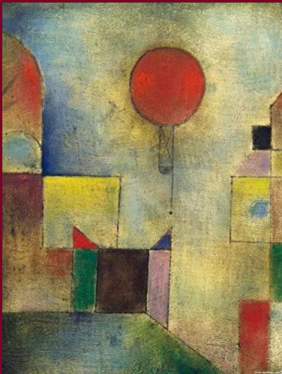
VÖRÖS LÉGGÖMB (1922)